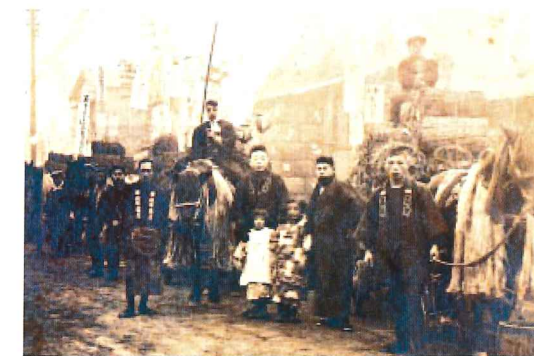
大正十四年の初荷風景 (右上荷車上の人物が初代社長)